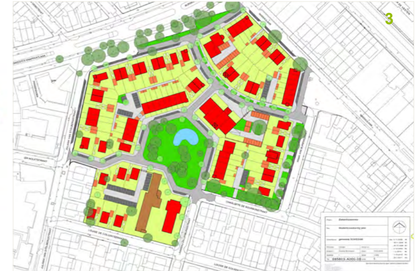
Ontwerptekeningen van Peter Verschuren, bureau Wissing

Gemeente Schiedam wil een nieuwe wijk Oranjeburgh op de plek van een gesloten ziekenhuis. Het oude ziekenhuis moet wijken voor woonhuizen. De bomen op het oude ziekenhuisterrein moeten blijven.