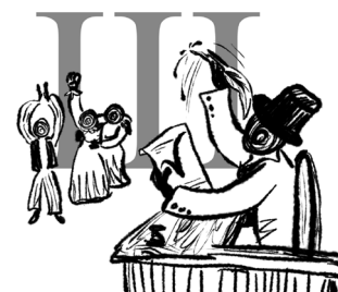
De gemeente keurt het voorstel goed.