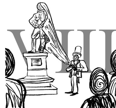
Het standbeeld wordt onthuld door de burgemeester.