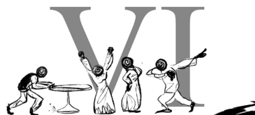
Bewonderaars organiseren zich in een comité.