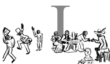
Het comité zoekt een kunstenaar.