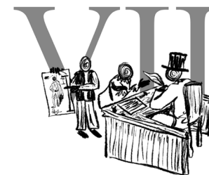
Het comité doet een aanvraag bij de gemeente tot plaatsen van een standbeeld van die persoon, groep of gebeurtenis.