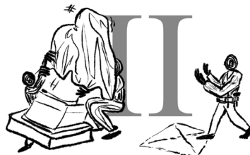
Het standbeeld wordt geplaatst.