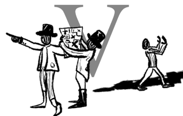
De gemeente bepaalt de plaats van het standbeeld.